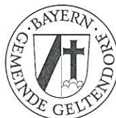
Wilhelm Lehmann Erster Bürgermeister