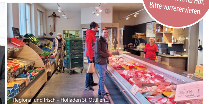
Regional und frisch – Hofladen St. Ottilien