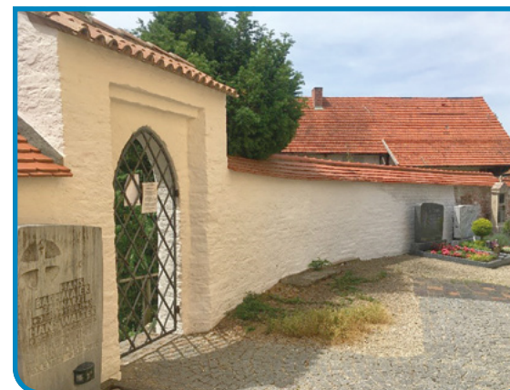
Durch die Sanierungs-Arbeiten erstrahlt der Friedhof Walleshausen wieder in neuem Glanz.