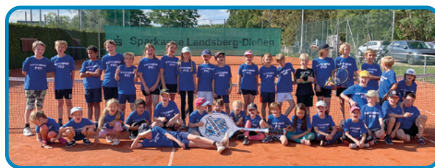
▲ Die Teilnehmer des Tenniscamps.

Die Zukunft dieser beiden Truppen ist daher zweifellos vielversprechend – beide Mannschaften sind fest entschlossen, die Herausforderungen der kommenden Saison anzunehmen und das hohe Spielniveau aufrechtzuerhalten. Kommt's einfach vorbei und schaut's uns zu – wir freuen uns über Fans am Platz!