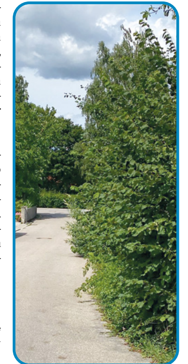
Bild rechts: Wenn die Hecke zu weit in die Straße hineinreicht, ist die Verkehrssicherheit gefährdet.

Deshalb der Appell an Sie: Bitte kontrollieren Sie in regelmäßigen Abständen, ob Anpassungen an Pflanzungen auf Ihrer Grundstücksgrenze erfolgen müssen. Diese Rücksicht auf andere erspart uns – aber auch Ihnen – unnötige Verwaltungsarbeiten.