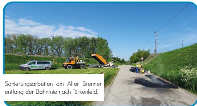
Sanierungsarbeiten am Alter Brenner entlang der Bahnlinie nach Türkenfeld.

Zu Straßenschäden kommt es häufig durch den Wechsel von Minus- zu Plusgraden und umgekehrt. Dadurch tritt der sogenannte „Wasser-Eis-Schlagloch-Effekt“ besonders oft auf. Durch Risse im Asphalt dringt Wasser ein und sammelt sich unter der Fahrbahndecke. Das zu Eis gefrierende Wasser dehnt sich aus. Die Fahrbahndecke hebt sich – es entstehen neue Risse. Das Eis schmilzt, wassergefüllte, brüchige Hohlräume bleiben zurück.