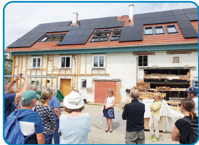
Im Rahmen der Bayerischen Energietage luden die Volkshochschule und die KLIMA 3 -Energieagentur zur Besichtigung einer Bauernhof-Sanierung in Türkenfeld (ggü. Hartl) ein, der eine umfassende Energieberatung voranging. Neben der Energieagentur freut sich auch die beteiligte Zimmerei über dieses Paradebeispiel für energetische Sanierung im ländlichen Bereich, wo häufig alte Bauernhöfe abgerissen werden oder ungenutzt leer stehen.

Informationen zu verschiedenen Veranstaltungen der Klima- und Energieagentur: www.klimahochdrei.bayern