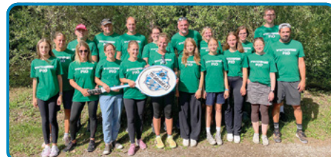
▶ Viele Betreuer kümmerten sich um den Verlauf des Tenniscamps.