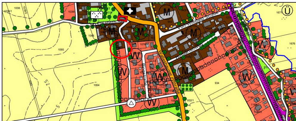
Abb. 2: Auszug rechtswirksamer FNP der Gemeinde Geltendorf

Der rechtswirksame Flächennutzungsplan der Gemeinde Geltendorf stellt das Grundstück Flur Nr. 1064/1 sowie die Teilfläche des Grundstückes Flur Nr. 1065/3 der Gemarkung Kaltenberg bereits als Wohnbauflächen dar. Im Westen des überplanten Grundstückes Flur Nr. 1065/3 sowie auf der ebenfalls überplanten Teilfläche des Grundstückes 1064 der Gemarkung Kaltenberg ist im Flächennutzungsplan zudem eine Grünfläche zur Ortsrandeinguinung ausgewiesen. Des Weiteren werden die überplanten Grundstücke im Flächennutzungsplan von einem großflächigen Bodendenkmal tangiert, das sich allerdings nicht im aktuellen Denkmalatlas des Bayerischen Landesamtes für Denkmalpflege wiederfindet.