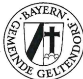
Robert Sedlmayr 1. Bürgermeister