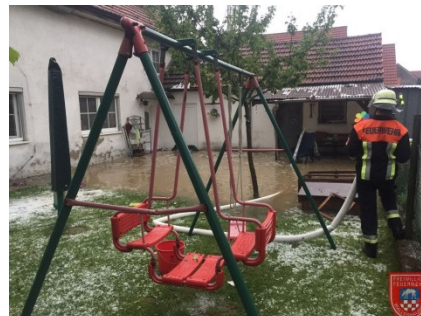
Foto Feuerwehr Mai 2016 in Wallehausen

In der letzten Zeit sind vermehrt Starkregenereignisse, unter anderem auch in der Gemeinde Geltendorf, aufgetreten. Vereinzelt kam es in mehreren Ortsteilen zu Kellerüberflutungen und Überschwemmungen. Obwohl die Kanalisation – aus rein rechtlicher Sicht – ausreichend dimensioniert ist, kann sie doch solch extrem anfallende Wassermengen in der Regel nicht fassen. Im Zuge der notwendigen Sanierungen der Regenwasserkanäle und der derzeit stattfindenden Überprüfungen mittels Kamerabefahrungen werden vorhandene Schäden mittelfristig beseitigt. Dies kann jedoch nicht innerhalb kürzester Zeit erfolgen, insbesondere da ein gewisser Sanierungsstau in der Gemeinde Geltendorf bzw. beim Abwasserzweckverband Geltendorf-Eresing besteht. Wir möchten daher eindringlich nochmals darauf hinweisen, dass jeder Hauseigentümer sein Haus gegen einen Rückstau aus den öffentlichen Kanälen, insbesondere bei Schmutz- und Regenwasser z.B. durch eine Rückstauklappe zu sichern hat. Darüber hinaus möchten wir die privaten Grundstückseigentümer, die einen Sickerschacht haben, bitten, diesen in regelmäßigen Abständen beispielsweise jährlich zu überprüfen. Dieser Sickerschacht verschlammmt mit der Zeit und kann dann die Problematik noch steigern. Unabhängig davon möchten wir darauf hinweisen, dass in etlichen Bebauungsplänen eine Festsetzung existiert, Gebäude mit wasserdichten Fenstern auszustatten.