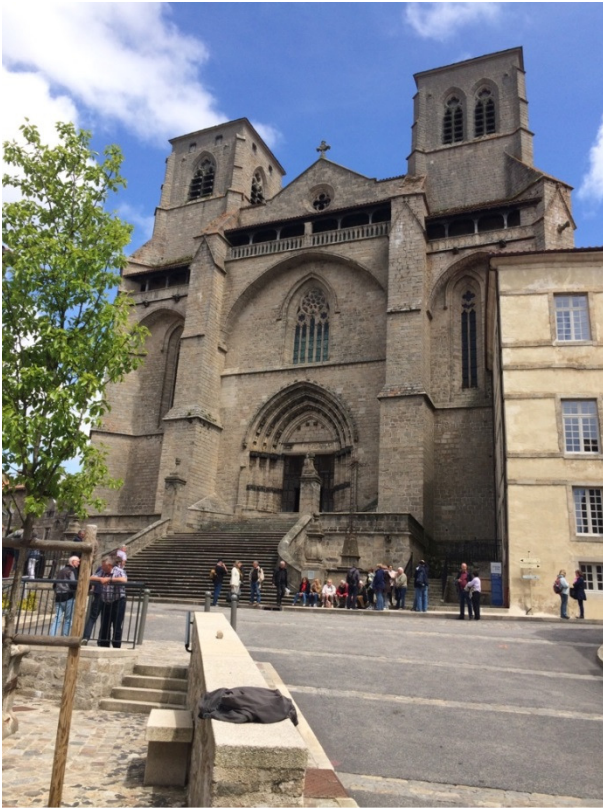
Kloster La Chaise-Dieu

Klarinetten-Livemusik. Idylle pur! Anschließend servierte man uns im Zug ein hervorragendes 3-Gänge-Menü.