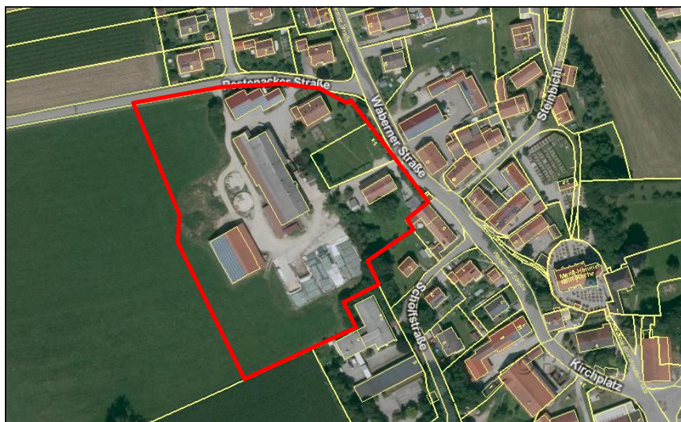
Übersicht Plangebiet

Bisher ist dieser Bereich in Walleshausen mit einer landwirtschaftlichen Hofstelle bebaut. Der Eigentümer beabsichtigt eine Umsiedlung des Anwesens auf ein Grundstück außerhalb des Geltungsbereiches. Um eine verträgliche und sinnvolle Nachnutzung des frei werdenden Areals sicher zu stellen, soll das Plangebiet nach der Entfernung der bestehenden Bebauung für eine gemischte bzw. für eine Wohnbebauung herangezogen werden. Das bestehende Wohngebäude im Nordosten des Plangebietes bleibt dabei in seinem derzeitigen Zustand erhalten und somit von den Planungen weitestgehend unberührt.