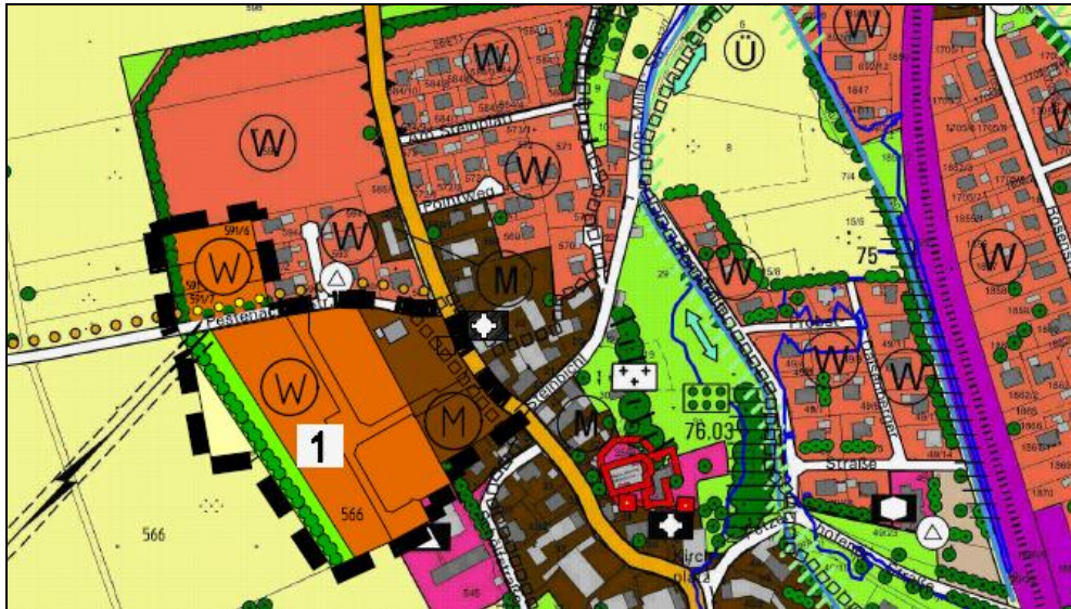
Auszug der genehmigten 1. Änderung des Flächennutzungsplanes der Gemeinde Geltendorf (wirksam seit 10.09.2015)

der öffentlichen Bekanntmachung dieser Genehmigung am 10.09.2015 auch Wirksamkeit erlangt. Der Bebauungsplan kann somit gemäß § 8 Abs. 2 BauGB aus den Darstellungen des wirksamen Flächennutzungsplanes (1. Änderung) entwickelt werden.